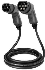
CABLE DE RECARGA