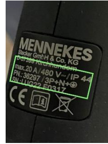
20A/480V - 20A/230V